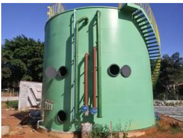
Foto 09: Vista tubulações externas