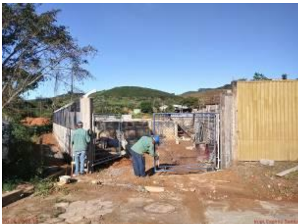
Foto 01: Vista geral da EEEB