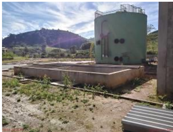
Foto 02 - Leito de Secagem