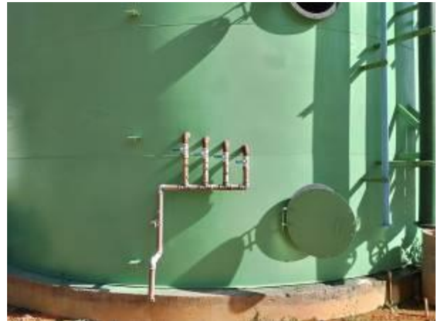
Foto 02: Vista Tubulação Coleta de Amostras