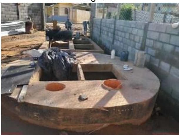
Foto 03: Vista Poço de Sucção