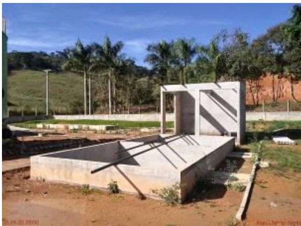
Foto 01 - Vista do Leito de Secagem